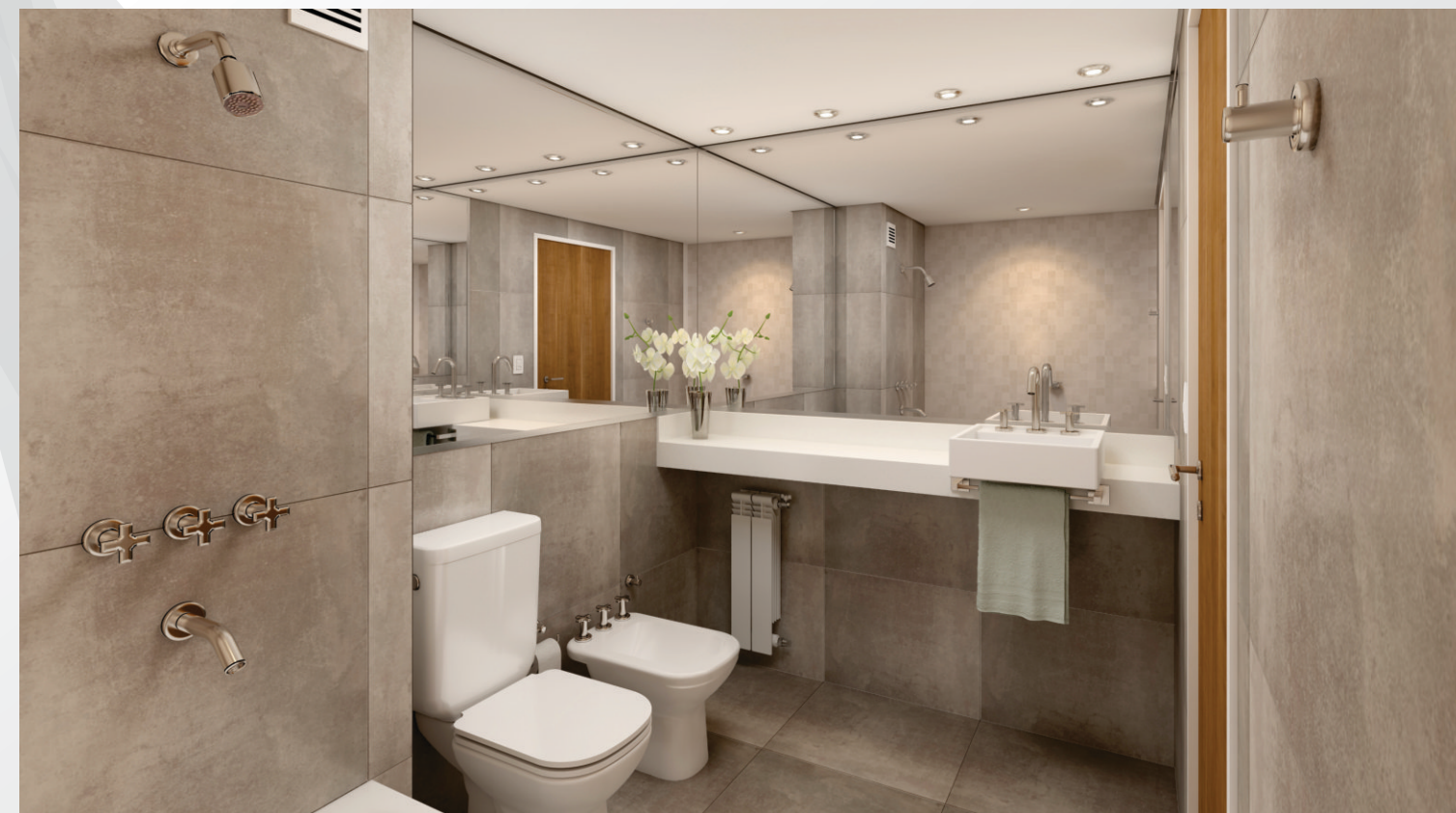
BAÑO DEPARTAMENTO A