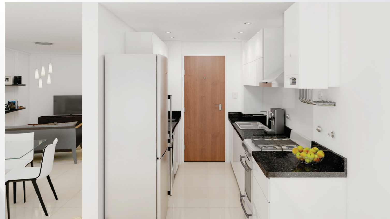
COCINA DEPARTAMENTO A