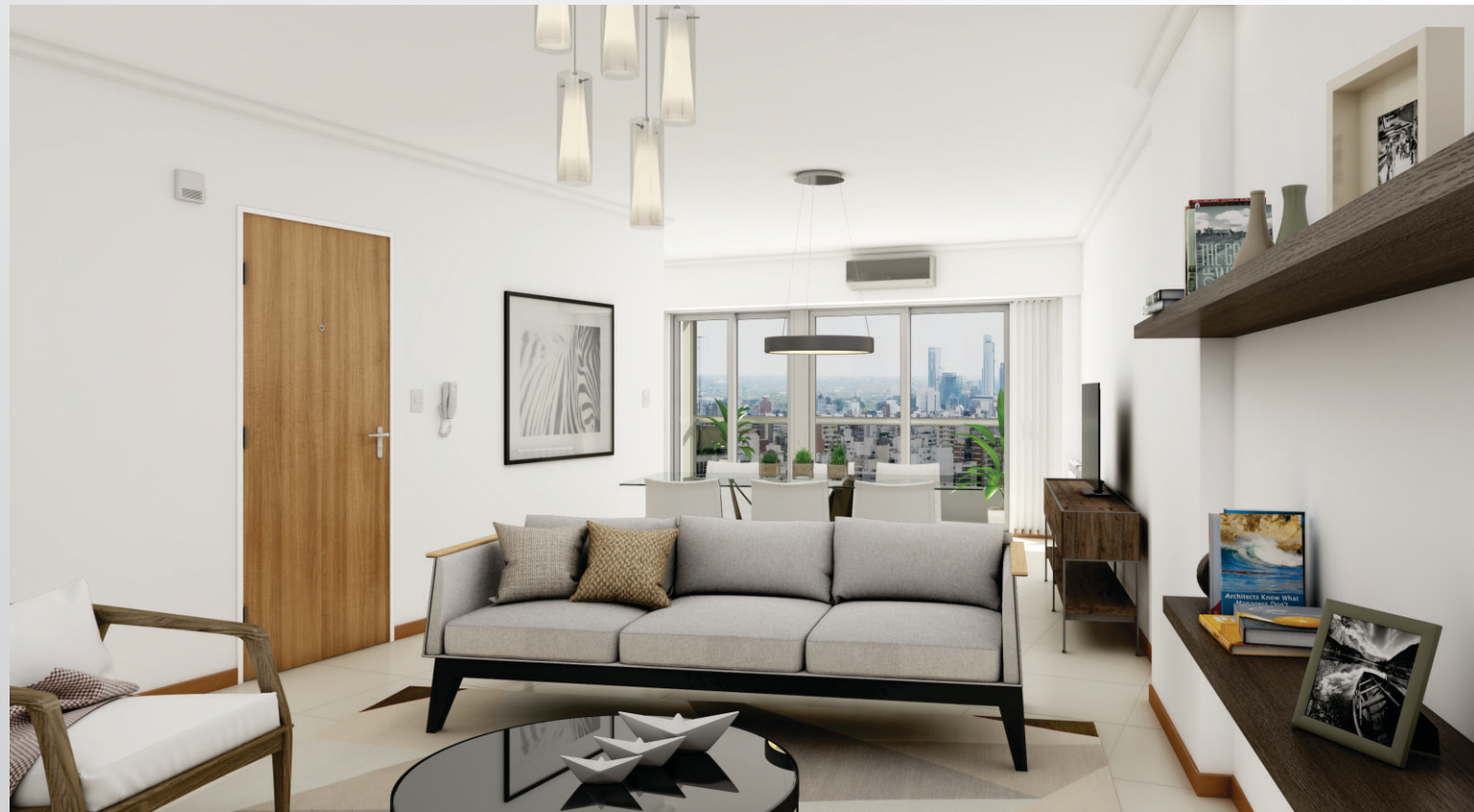
LIVING COMEDOR DEPARTAMENTO A